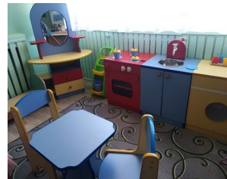
Уголок сюжетно-ролевых игр